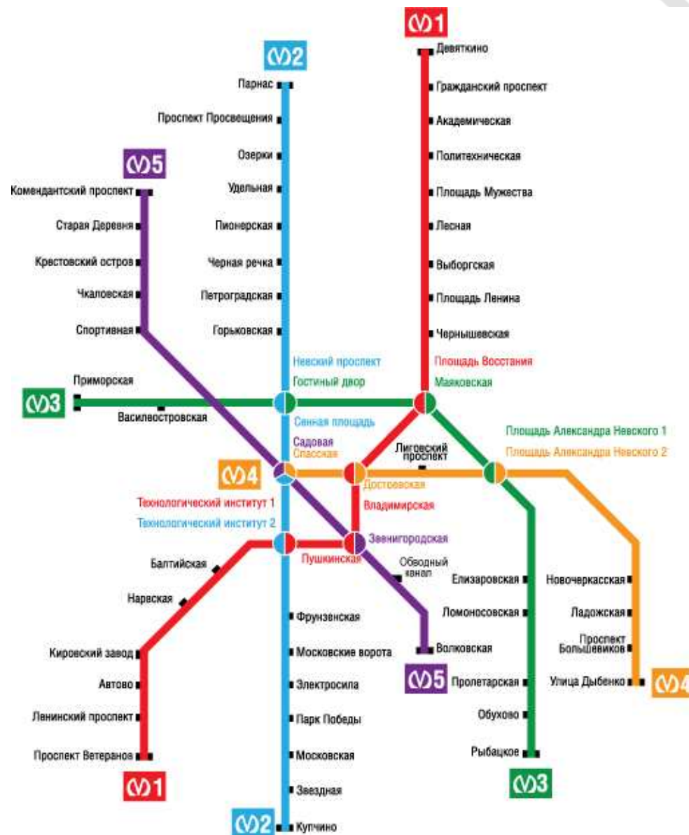
Рисунок 1. Схема Санкт-Петербургского метрополитена

! Сохраняйте билет в течение всей поездки на автобусе, трамвае или троллейбусе т. к. в случае проверки необходимо будет предъявить его контролеру.